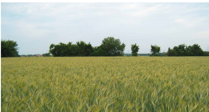
Hecken werden abschnittsweise auf den Stock gesetzt, damit Tiere, die in der Hecke leben auf andere Teilbereiche ausweichen können.