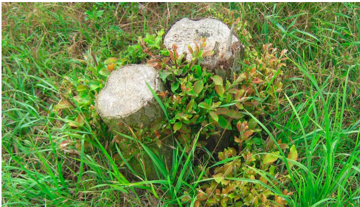
Nach einem starken Rückschnitt schlagen die Gehölze aus dem Stock neu aus, so dass die Hecke von unten heraus wieder dicht aufwächst.

Dichte, buschige, mehrreihige Hecken haben vielfältige Funktionen. Sie sind Lebensraum, sie bieten Deckung, Nistplatz und Windschutz. In ihren verschiedenen Zonen herrscht ein typisches Kleinklima, schattig feuchte Bereiche im inneren der Hecke bis hin zu sonnigen, trockenen Zonen auf der Südseite der Hecke. Es wurden bis zu 1.500 Tierarten in strukturreichen Hecken gefunden. Um diese Lebensraumvielfalt zu erhalten, müssen Hecken regelmäßig gepflegt werden.