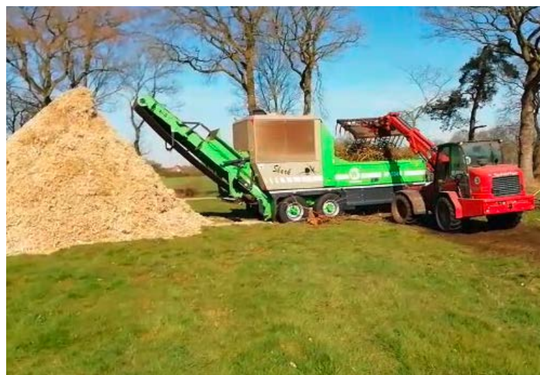
Das Schnittgut aus der Hecke kann mit einem Häcksler zerkleinert werden. Die Hackschnitzel können z. B. für die Wärmeerzeugung genutzt werden.