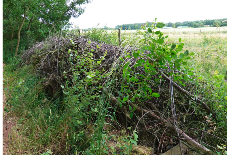
Lesesteinhäufen und Totholz bieten zusätzliche Kleinstrukturen, die gerne von den Tieren in der Hecke angenommen werden.