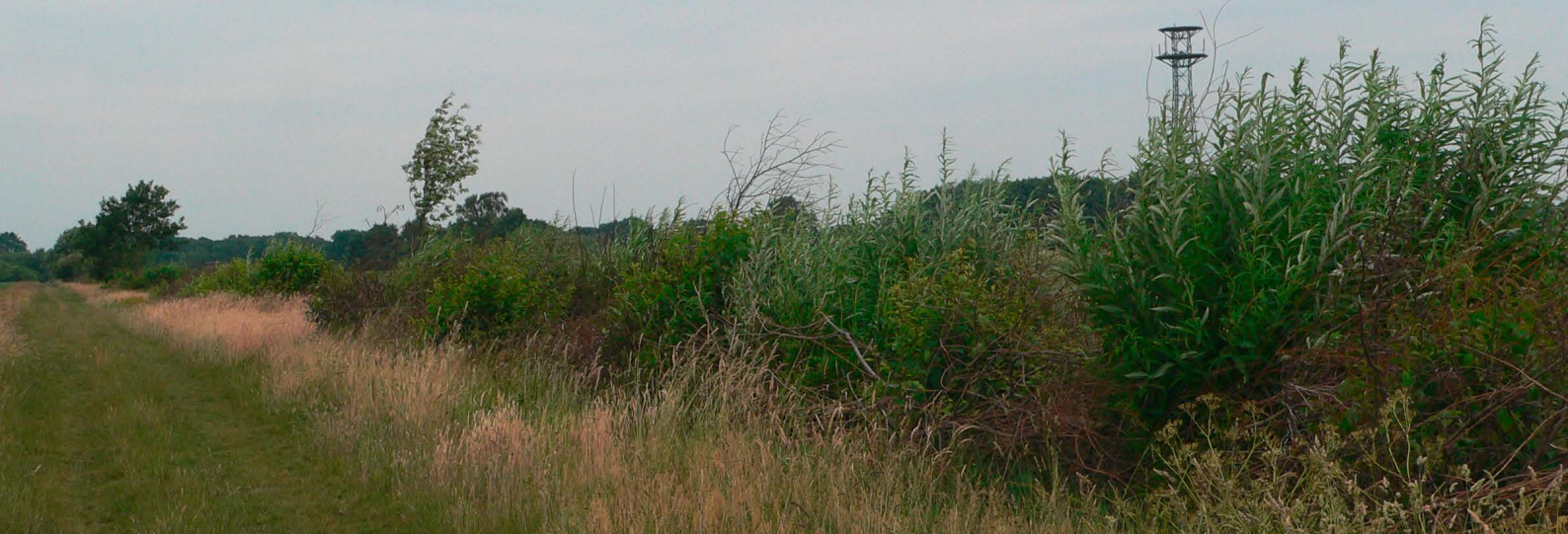
Bereits im Frühjahr nach dem Schnitt bilden die Sträucher lange neue Triebe und bieten wieder einen dichten Lebensraum.