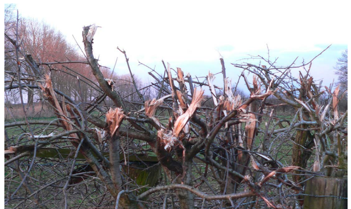
Ein sauberer, leicht schräger Schnitt wie im linken Bild sorgt dafür, dass Feuchtigkeit von den Stümpfen abfließen kann. Werden die Gehölze dagegen mit einem Hächsler eingekürzt, sind die Schnittstellen zerfranst und faulen leicht bei eindringender Feuchtigkeit.