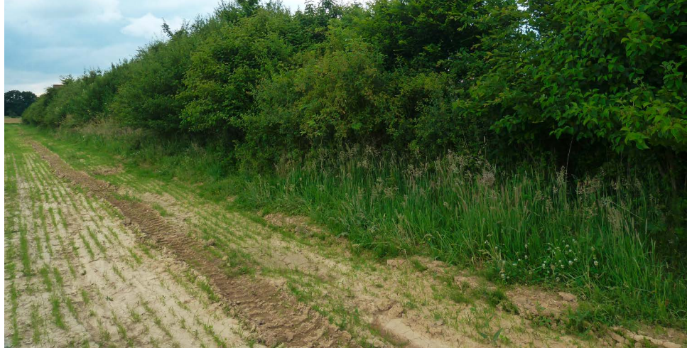
Die im Jahr 2002 neu gepflanzten Hecken sind zu dichten Strukturen in der Landschaft geworden.