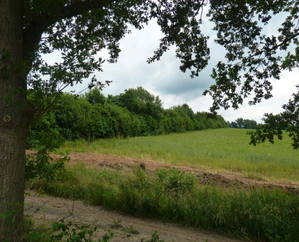
Die Hecken auf dem Grießhof tragen zu einem guten Verbund der Biotope dieser Region bei.