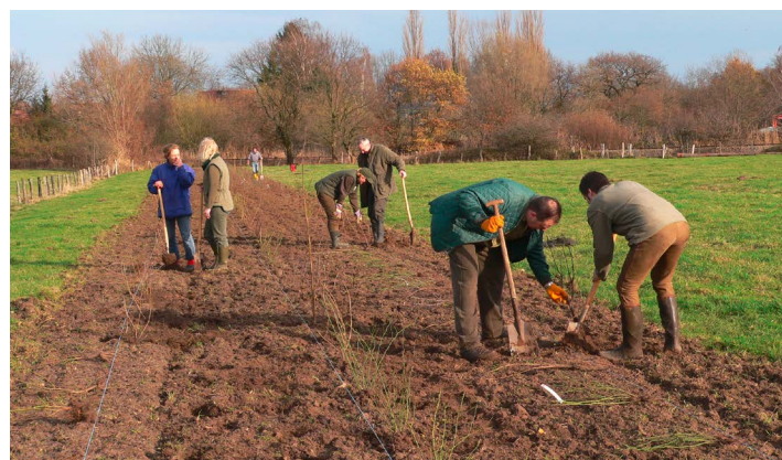
Eine Richtschnur sorgt für gerade Pflanzlinien. Sie erleichtern die spätere Pflege der Hecke.